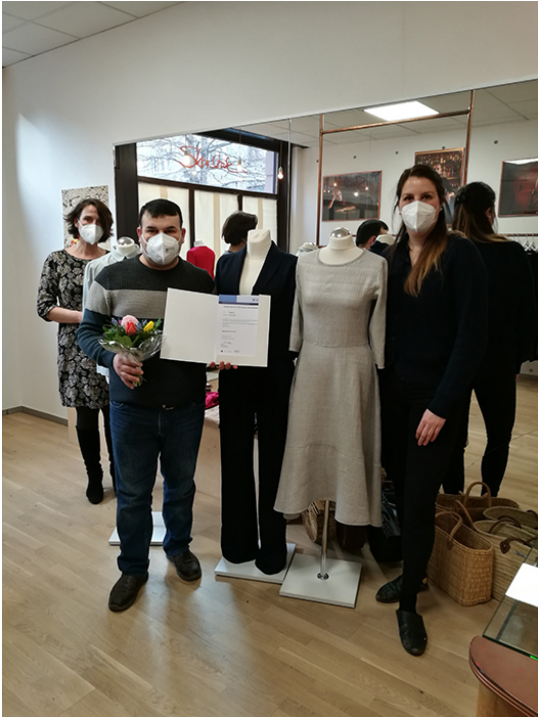
■ März 2021